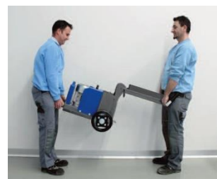
Položaj za nošenje