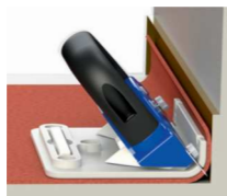
2. Rubni rezač