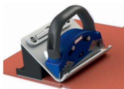
1. Rezač šava