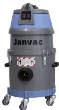
Standardna izvedba s 16 L kontejner