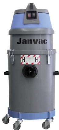
Janvac 1600-H Power s 35 L kontejner